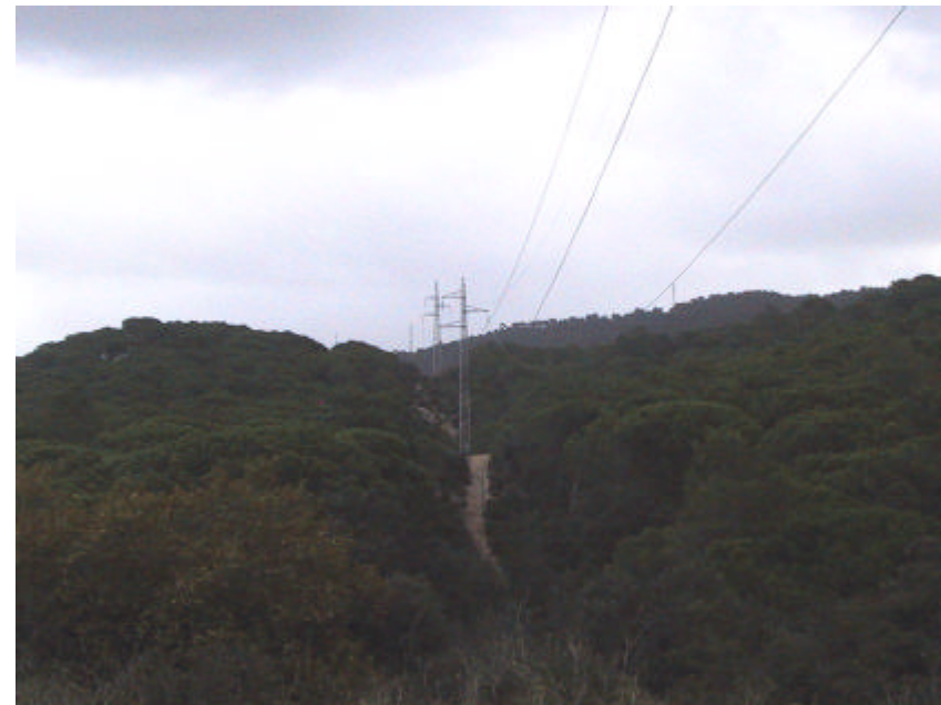
Fotografia 1.1.2. Corredors de sota les línies d'alta tensió, desproveïts de vegetació i amb processos d'erosió importants (xaragalls).

Igualment, caldrà realitzar un inventari d'aquelles línies que presenten o, potencialment, són susceptibles de tenir aquesta problemàtica.