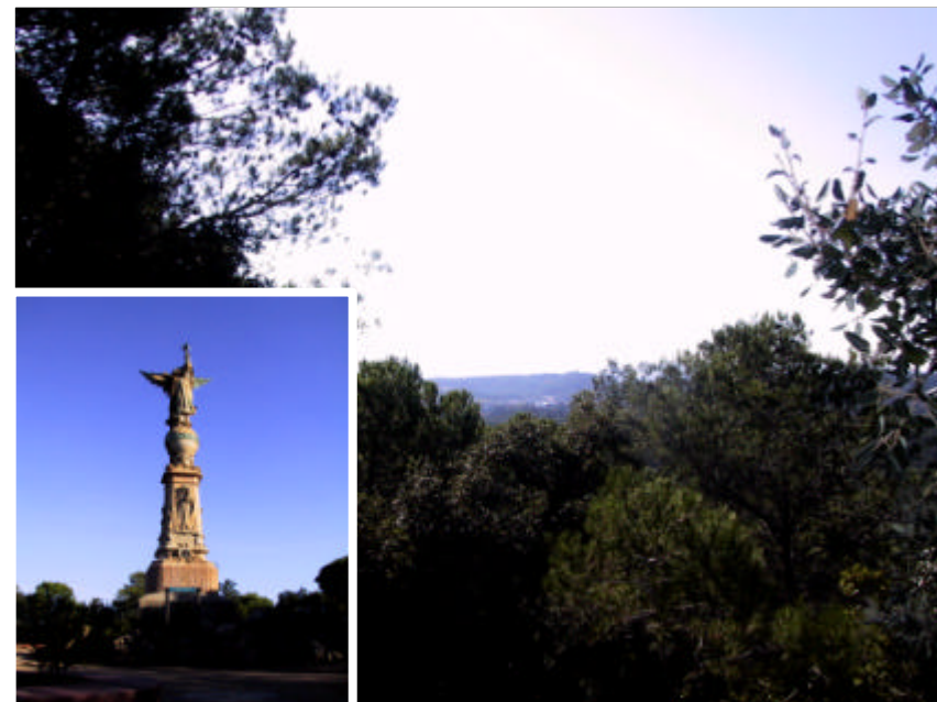
Fotografia 2.4.2. Vista des de l'Àngel i detall del monument existent. Unes tallades i podes selectives són bàsiques per condicionar la zona com a punt d'interès paisatgístic.

Caldrà una adequació de la zona de l'Àngel, tot i que la primera avaluació indica que no és necessària una gran operació de condicionament. Es recomana, en cas de ser necessari, la poda dels arbres que dificultin l'observació del paisatge. Al mateix temps, es considera positiu la instal·lació d'elements de rotulació informatius i de localització, així com una rosa dels vents o indicar la direcció dels llocs visibles per facilitar el seu reconeixement. Caldrà però que els distints tipus de senyalització de camins, itineraris, serveis públics, indrets d'interès instruccions per als visitants, etc. responguin respectivament a models unitaris d'acord amb les normatives vigents. S'intentarà adequar l'indret com a zona de descans i gaudiment de vistes, sense artificialitzar l'àrea.