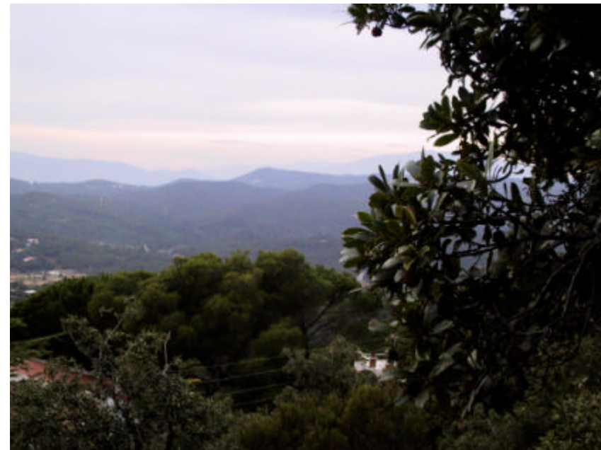
Fotografia 2.5.2. Zones properes al sòl urbanitzable.

Es vetllarà perquè les desclassificacions es realitzin sempre de l'exterior a l'interior de les àrees urbanitzables i intentant establir corredors biològics interiors.