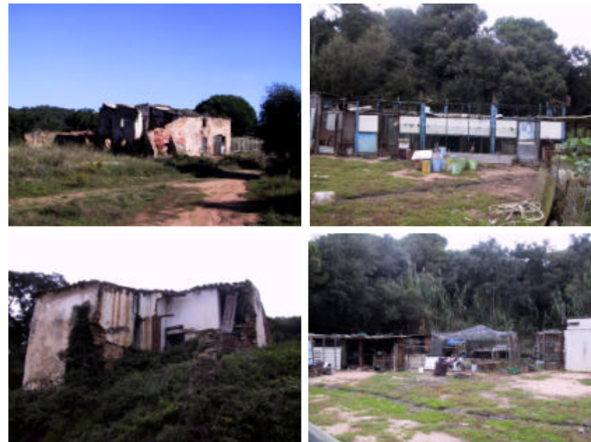
Fotografia 1.4.3. Edificacions en ruïnes (a l'esquerra) i àrees amb la presència de porxos i coberts en condicions precàries, presents a la zona de la Bitlloca (a la dreta).

Per procedir a l'expropiació s'elaborarà un programa d'expropiació, integrat per un pla de delimitació, un document en el qual es descriu els béns o drets afectats i es relacionin els propietaris i un estudi econòmic sobre el cost de l'expropiació; aprovat inicialment per la Diputació de Girona, es sotmetrà a informació pública, amb citació expressa dels propietaris afectats i audiència a l'Ajuntament per un termini de 15 dies i serà aprovat definitivament, per la mateixa Corporació.