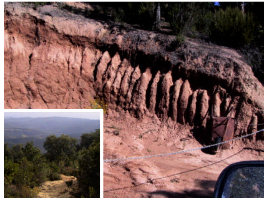
Fotografia 1.1.1. Exemples de talusos erosionats sobre leucogranits (sauló) i de camins mal traçats, a moltes de les pistes forestals del terme municipal.

Igualment cal complir allò que disposa l'article nº153 del PGOU sobre protecció de camins rurals pel que fa a separació de tanques i pavimentació de camins.