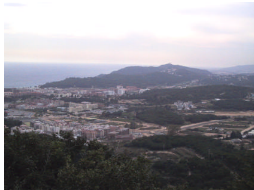
Fotografia 2.2.2. Zones de l'aqüífer quaternari de les parts més baixes del municipi, en sòl no urbanitzable.

Àrea Actuació. Tota la zona del sòl no urbanitzable.