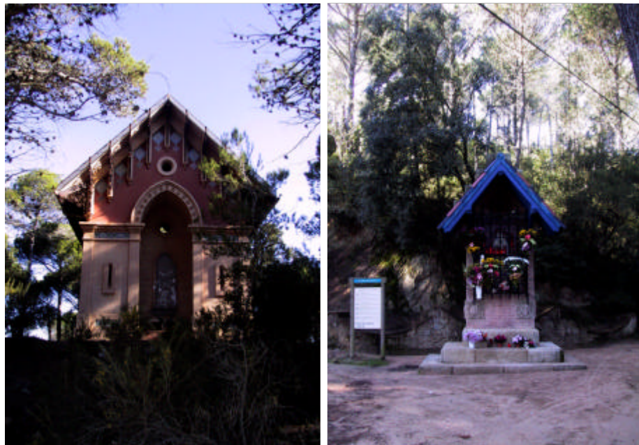
Fotografia. 2.4.3. Dos elements, un a la zona de l'Àngel (esquerra) i l'altra, la Capella de la Mare de Deu de Gràcia (dreta), que quedarien inclosos en el traçat del passeig Arqueològic.

Cal ressaltar però que aquesta proposta entre amb discussió amb el recent projecte de construcció de la prolongació de l'autopista de Palafròls fins a Tossa de Mar. Segons aquest, el traçat transcorre en paral·lel i a pocs metres del camí de Sant Pere del Bosc, cosa que condiona la proposta per aquest passeig Arqueològic. En el cas de que el traçat projectat fos una realitat, l'atractiu tan paisatgístic com ambiental, el silenci, quedarien pertorbats per el pas dels vehicles, per tant el principal atractiu no seria tal.