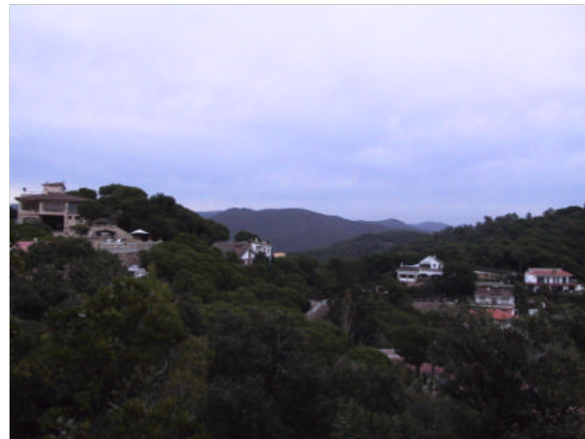
Fotografia 2.1.2. Urbanitzacions situades en zones de risc elevat per la seva continuïtat amb el bosc.

Existeixen antecedents d'importants pèrdues humanes a les urbanitzacions del municipi que fan més necessari pensar en la realització d'un Pla Municipal d'Evacuació d'Urbanitzacions, a més del fet que Lloret està classificat com una zona d'alt risc d'incendi segons la legislació.