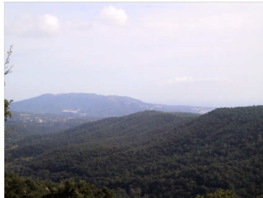
Fotografia 2.1.1. Vessants del Montbarbat, on s'aprecia la continuïtat del combustible, amb espècies de matollars força inflamables. La quantitat de combustible varia entre 10 i 15 T/ha.

Cal remarcar que les dues primeres directrius del Pla de Prevenció d'Incendis estan parcialment realitzades (s'ha establert la xarxa bàsica i el punts d'aigua per diferents parts del municipi). Tanmateix, cal integrar totes les dades cartogràfiques i de bases de dades a un Pla de Prevenció que unifiqui tots els aspectes a tenir en compte i que en permeti l'ús i consulta als diferents sectors implicats.