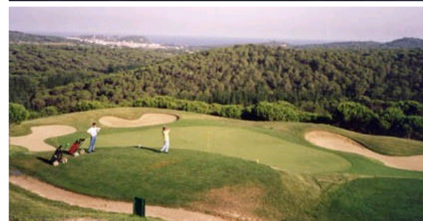
Fotografia 1.4.6. Vistes del camp de golf de l'Àngel, de 9 forats i el més gran dels tres camps de golf existents al municipi.

Àrea Actuació. Tot el sol no urbanitzable i especialment zones de possibles ampliacions dels camps de golf ja existents.