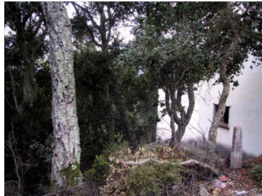
Fotografia 1.1.4. Continuitat del combustible entre el bosc i les urbanitzacions. S'aprecia la presència de restes de branques seques de sureres.

A més, cal que es tinguin en compte les mesures addicionals establertes en períodes d'especial risc.