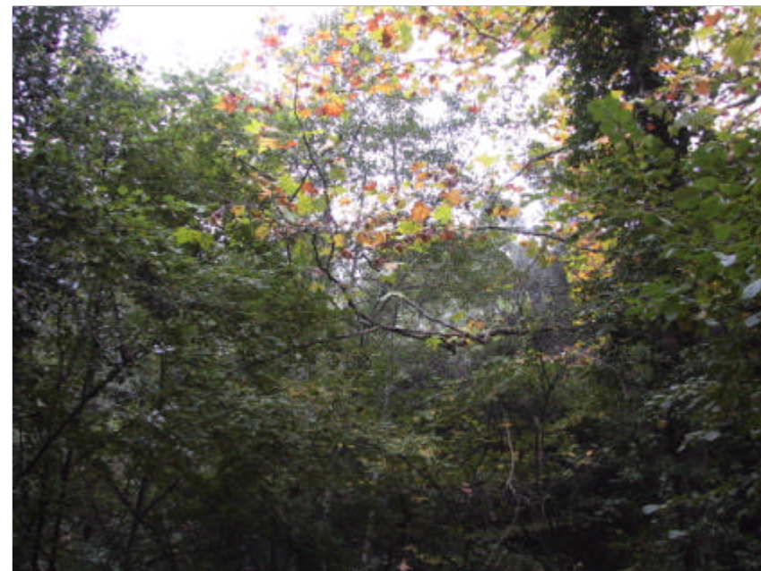
Fotografia 2.3.1. Vall del torrent del Oms, d'elevada qualitat ambiental.

Després de fer l'inventari, el diagnòstic i determinar tots aquells factors a corregir, es poden establir prioritats en les diferents rieres del municipi per tal de actuar-hi conjuntament en un Pla de Rieres on s'hi poden incorporar les actuacions 1.2.1. de regulació del Domini Públic Hidràulic, 2.3.2., de restauració de rieres, 2.5.2. de desclassificació del sòl en aquelles zones més vulnerables, etc.