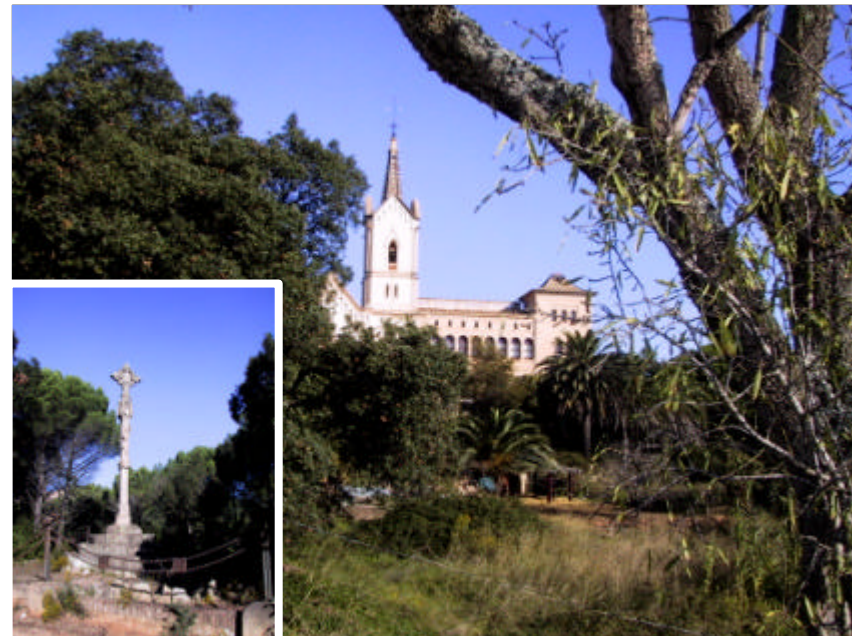
Fotografia 2.4.1. Dues vistes d'elements del patrimoni cultural, La Creu de Terme (fotografia petita) i Sant Pere del Bosc (fotografia gran) observades des d'un dels camins del terme municipal.

Es creu adient la consulta a grups excursionistes i societats cíviques i culturals per tal de demanar-los opinió sobre quins serien els itineraris més adients. També es planteja la necessitat d'acordar a nivell comarcal, amb les entitats, amb el sector turístics, etc., la definició de noves rutes, i executar els projectes d'adequació i senyalització, i un programa de promoció continuada dels mateixos que inclogui l'edició de materials proporcionals i tríptics-guia d'edició regular.