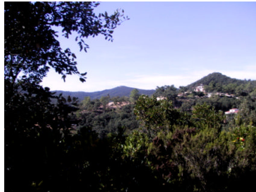
Fotografia 1.4.1. Mosaïc de sòl urbanitzat, urbanitzable i no urbanitzable al NO del municipi.

Com a recomanació pròpia d'aquesta actuació, existeix el compliment directe de les regulacions d'usos i activitats en el sòl no urbanitzable. Per tant, convé vigilar de prop, tot el que succeeixi en aquestes zones com per exemple, edificacions il·legals.