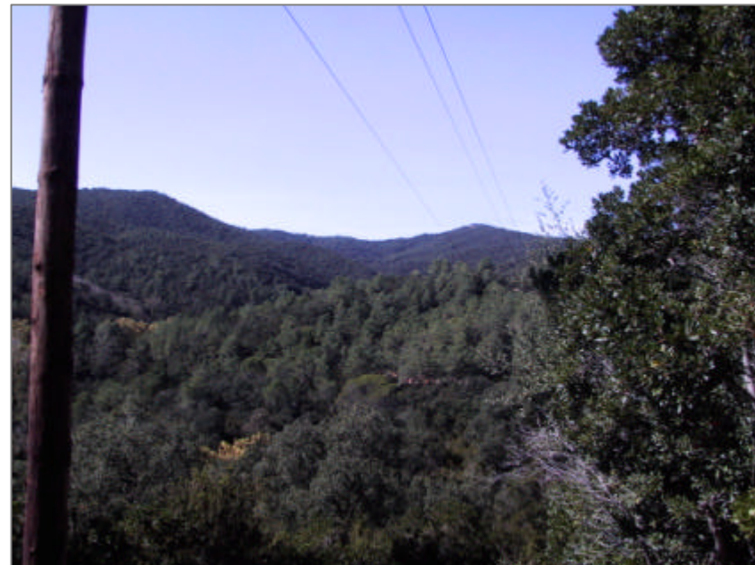
Fotografia 1.4.2. Visió d'una infraestructura lineal que discorre pel sòl no urbanitzable del municipi.

Àrea Actuació. Infraestructures existents o de nova instal·lació presents al sòl no urbanitzable de Lloret.