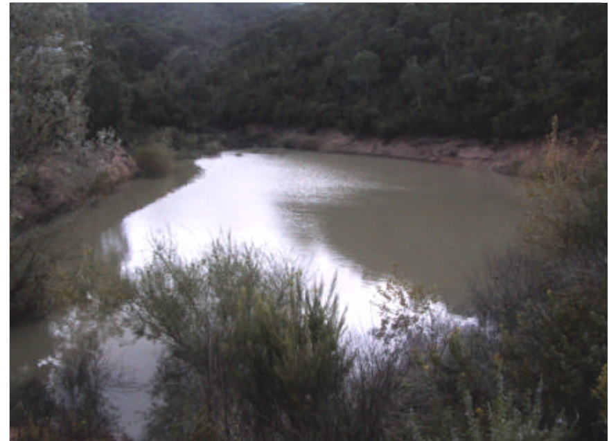
Fotografia 2.2.1. Bassa propera al torrent del Sot d'Aiguabona amb presència d'espècies de ribera com el salze.

La xarxa de fonts, surgències, etc. està molt relacionada amb el medi litològic, hidrogeològic i geomorfològic del relleu del municipi de tal manera que, en relació a les propostes d'actuacions d'educació ambiental que figuren en aquest document, aquest aspecte del medi pot servir per que els habitants de Lloret coneguin els orígens i curiositats dels punts d'aigua de Lloret.