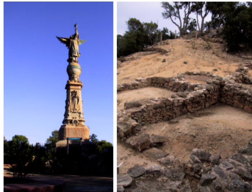
Fotografia 1.4.3. Visió de dos elements del patrimoni cultural de Lloret de Mar. Monument de l'Angel (fotografia esquerra) i Montbarbat (fotografia dreta).

- L'Administració de la Generalitat i l'Administració local poden acordar l'expropiació, per causa d'interès social, dels immobles que dificultin la utilització o la contemplació dels béns culturals d'interès nacional, atemptin contra l'harmonia ambiental o comportin un risc per a llur conservació.