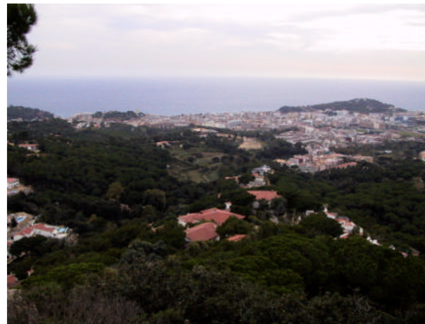
Fotografia 1.4.4. Visual Sud des de Puig Castellet.

Àrea Actuació. Tot l'àmbit del sòl no urbanitzable