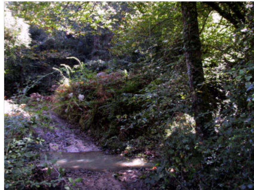
Fotografia 2.3.2. Vegetació de ribera a l'encreuament amb un camí de forma poc impactant.

El manteniment dels marges i de les riberes fluvials es podrà fer amb el suport de l'Agència Catalana de l'Aigua, organisme responsable de totes les funcions de control de qualitat del Domini Públic Hidràulic. Aquestes actuacions poden gestionar-se, en cas de constituir-se, des d'una Entitat Local de l'Aigua (ELA), òrgan de cooperació entre els ens locals i l'Agència Catalana de l'Aigua per a una millor gestió dels recursos hídrics i de les obres hidràuliques i per la prestació de serveis relacionats amb l'aigua.