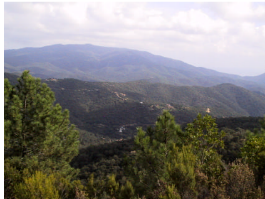
Fotografia 1.1.3. Massa forestal del municipi, integrada per finques formades per suredes i pinedes, aquestes darreres tant de regeneració natural com artificial.

Totes les actuacions tindran en compte els possibles condicionants establerts per les altres línies d'actuació tanta a nivell de regulació, com d'actuacions futures (Pla de Prevenció d'Incendis, etc.).