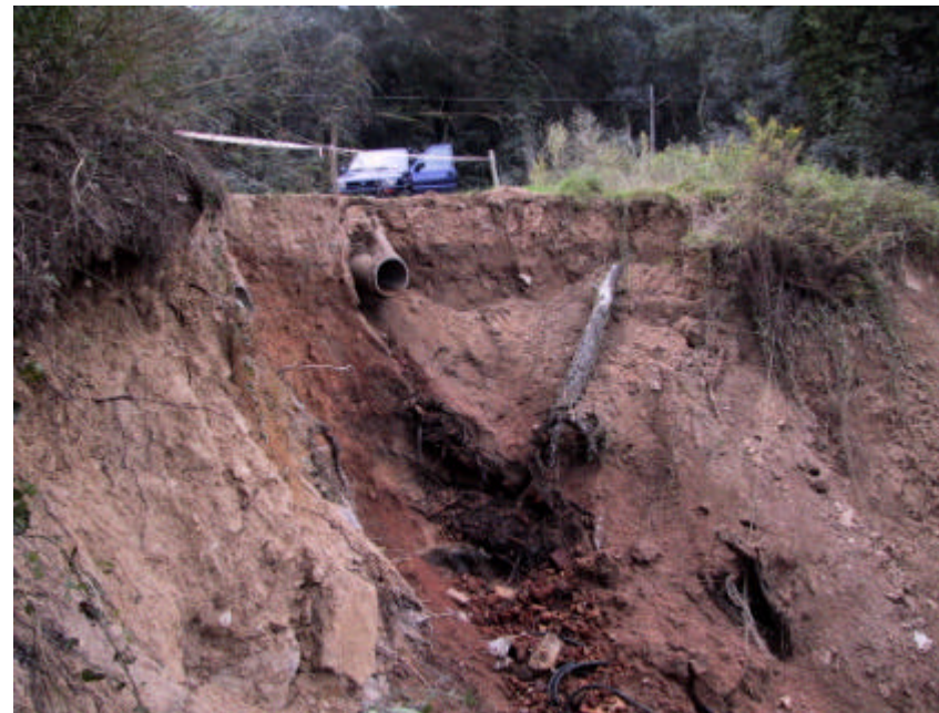
Fotografia 1.2.1. Desprendiment de granitoides d'un dels marges de la riera que transcorre propera al Pitch & Putt Ecogolf Lloret i a l'abocador.

Aquesta actuació es considera prioritària ja que, en funció d'aquest atermenament, es podran impulsar des de l'Ajuntament, actuacions de millora en aquests espais. Així, allà on hi hagi activitats dins la zona de DPH, l'Ajuntament disposarà del marc legal per tal de poder pactar amb cadascuna d'aquestes activitats, alguns canvis en l'espai que ocupen.