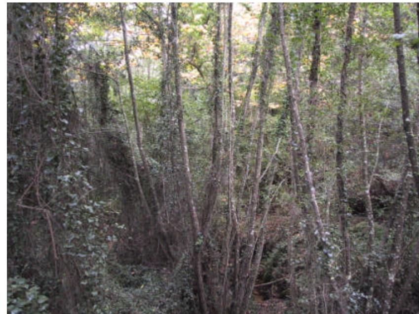
Fotografia 1.3.1. Torrent de Passapera, verneda molt propera a la zona on està projectada l'autopista i la seva àrea de peatge.

Altrament i en la mesura del possible, aquesta actuació també pot contemplar iniciatives d'interpretació del medi (quaderns d'educació ambiental, itineraris autoguiats, sortides ciutadanes, etc.) per apropar aquests espais a la gent, prioritant sempre les actuacions de conservació i millora.