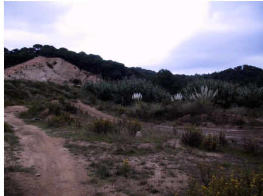
Fotografia 1.4.5. Presència de desmunts i zones amb escassa o nul·la vegetació, molt susceptibles a l'erosió hídrica en condicions de torrencialitat i sobre sauló.

Per tal d'estabilitzar els talussos i minimitzar els processos d'erosió sobre materials de sauló, cal revegetar les zones amb major pendent mitjançant plantes autoctones ( Quercus sp., Pinus sp. o arbusts i si cal, amb hidrosembra de graminies i lleguminoses adaptades).