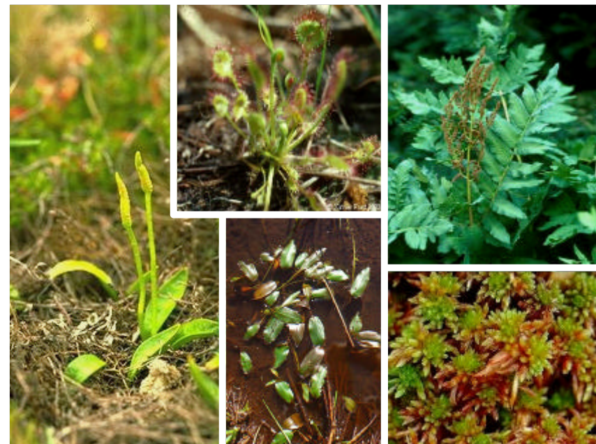
Fotografia 1.3.2. Diferents espècies protegides pel PEIN Massís de Cadiretes i lligades a zones humides i cursos temporals o permanents d'altres punts del municipi no protegits (d'esquerra a dreta i de dalt a baix): falguera de rei ( Osmunda regalis ), Drosera rotundifolia , llengua de serp ( Ophioglossum lusitanicum ), espiga d'aigua ( Potamogeton polygonifolius ) i Sphagnum subnitens .

Àrea Actuació. Zones dels torrents esmentats incloent la vegetació pròpia de ribera i la seva àrea d'influència.