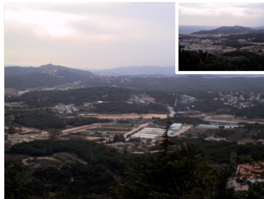
Fotografia 2.4.5. Vistes parcials del sol no urbanitzable del municipi alternant-se amb diferents usos.

Però per poder aplicar i gestionar la normativa i les seves actuacions amb garanties és necessari que sigui conegut i participat per la gent, des dels agents directament implicats, fins als ciutadans en general. L'aprovació de la normativa per ella mateixa no assegura que sigui conegut i que els agents s'impliquin en la seva execució.