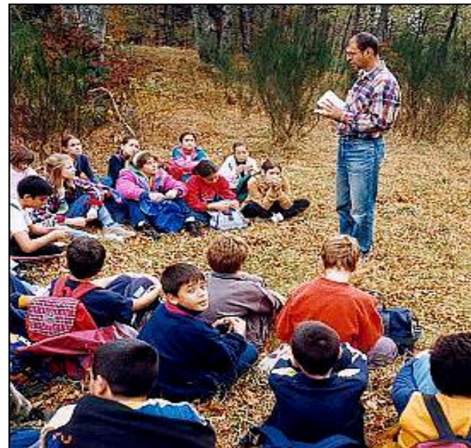
Fotografia 2.4.4. Grup d'escolars en el que podria ser una classe programada des del centre d'educació ambiental.

Per això, cal conèixer les possibilitat d'ubicació d'aquest centre per tant, requereix d'un inventari de masies abandonades, o barraques agrícoles.