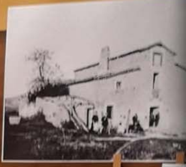
Mas de Can Fornés al sector de Sant Quirze, 1950 circa

La cuina era el centre neuràlgic de la casa, el lloc on es reunia el nucli familiar, on es menjava però també era el lloc de reunió del nucli familiar. Aquesta tant podia estar a la planta o al pis i era un espai eminentment domèstic i vital. A la cuina trobàvem: la llar de foc, la llenya, els fogons, on es feia el menjar amb les brases de la llar de foc, les picques o algüeres de pedra, que sovint tenien rajoles a la paret per a protegir-la de la humitat i diferents elements de mobiliari, com taules, cadires i fescos. No hi faltaven les lleixes o prestatges on es col·locaven plats de terrissa, cassoles i altres atuells. A la cuina també s'hi realitzaven tot tipus de feines, com ara teixir, filar i cosir, pastar, desgranar i triar llegums, passar el rosari... La cuina, també, organitzava altres espais secundaris al seu voltant, com el rebost, el pastador i el celler.