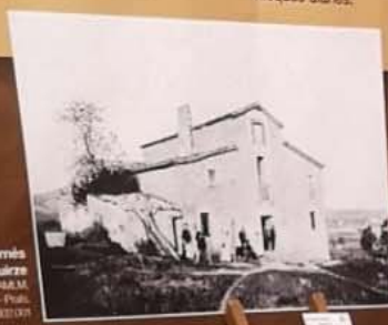
Mas de Can Fornis al sector de Sant Quirze de Vals i Prats, 1993

El complement més característic de la llar de foc catalana era el gran banc de fusta que l'envoltava. Anomenat escó o escon aquest se situava davant de la llar de foc, tenia un respallier alt que protegia l'esquena del fred. També hi trobem la llarga taula de fusta on es reunien per fer els diferents àpats i també sovint mossos i treballadors que ajudaven en les tasques diàries.