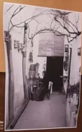
Dona cosint regims en un pati estivar