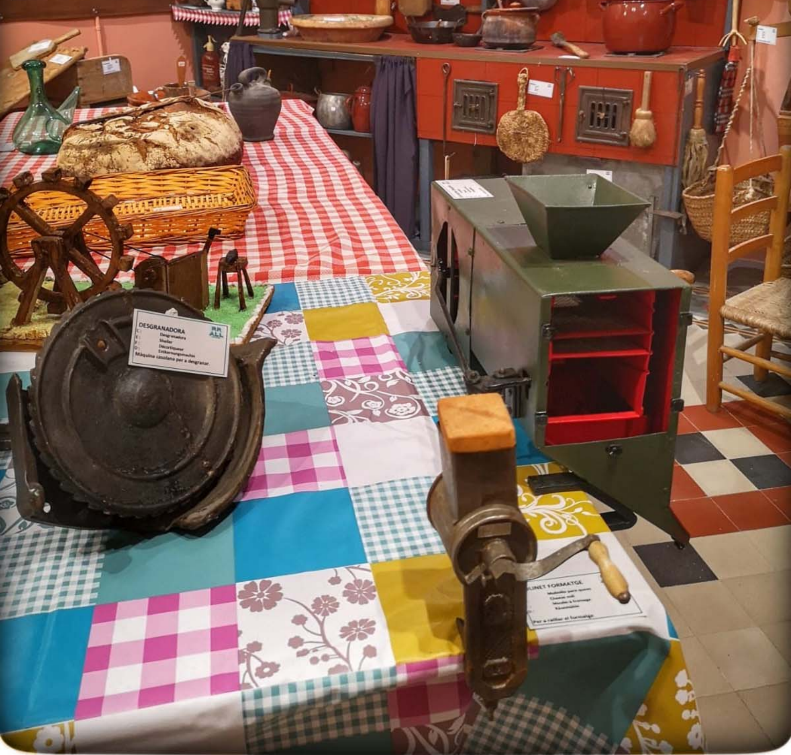
DESGRANADORA C: Desgranadora E: Molin P: Erntemaschine M: Erntemaschine Màquina catalana per a desgranar.