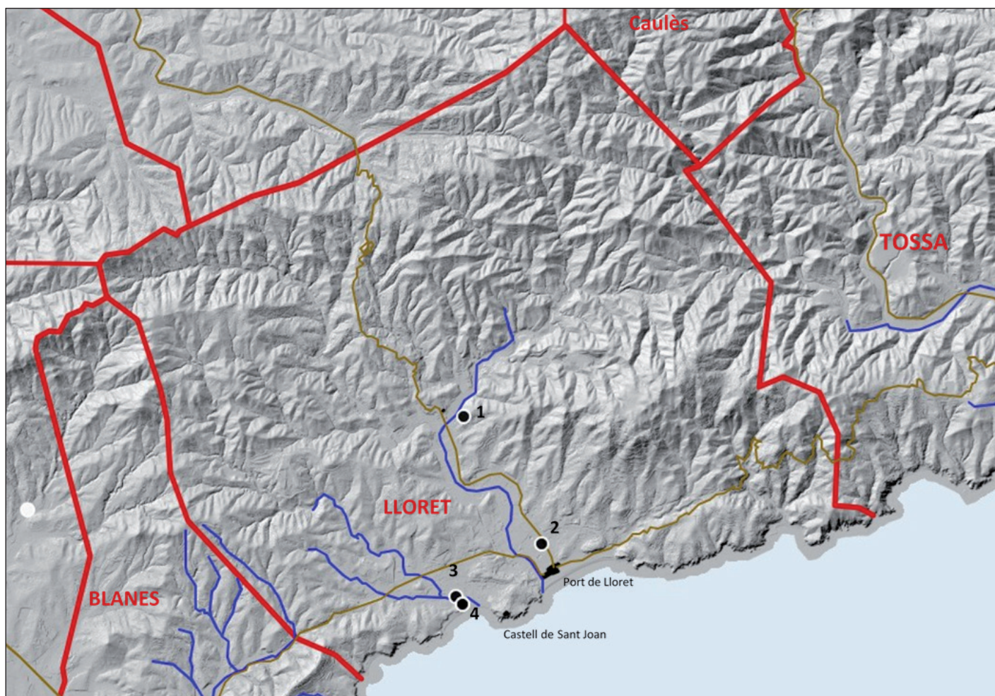
Localització aproximada dels masos i bordes de Gabriel Baell. 1: Gamell. 2: Llagostera. 3: Malida. 4: Salvador.

que en aquell moment només en queda la quintana on hi era construït el mas, indivisa entre la pabordia i el monestir de Sant Salvador de Breda. 11 Aquest mas Salvador, situat a Fenals, és capbrevat el 1320 per Jaume Salvador. El té per a la pabordia i el castlà, juntament amb la quintana i diverses feixes i camps, així com un clos i vinyes que té per al paborde i el monestir de Sant Salvador. 12 No sabem en quin moment, però entre 1320 i 1373 aquest va passar a engrèixar el patrimoni dels Gramell –potser va quedar rònc ec després de la Pesta Negra.