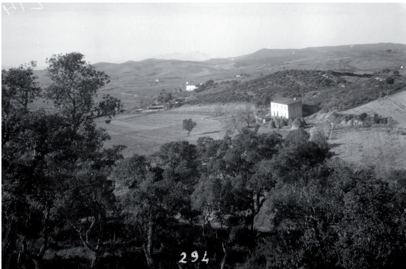
Can Coll de n'Horta i Can Pi, dos masos lloretencs.

Procedència: SAMLML - Fons Martínez-Planas. Data: Ca. 1900. Autoria: Emili Martínez i Passapera. CID: 510.000.700_319.016.008.