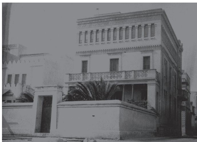
Façana posterior i pati de la Casa Egípcia. Data: Ca. 1930. CID: 526.001.400_340.091.013.