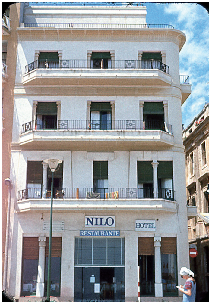
Façana de l'Hotel Nilo (1970 ca.). La Casa Egípcia es va transformar en aquest hotel a partir de la dècada de 1950.