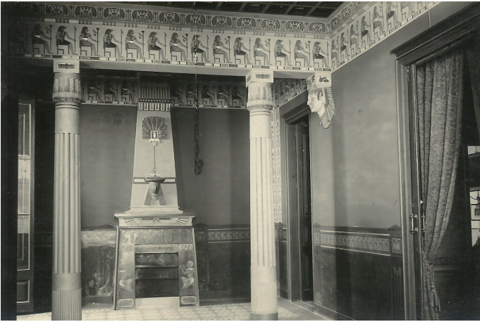
Menjador i xemeneia de la Casa Egípcia. Data: Ca. 1915. PC.