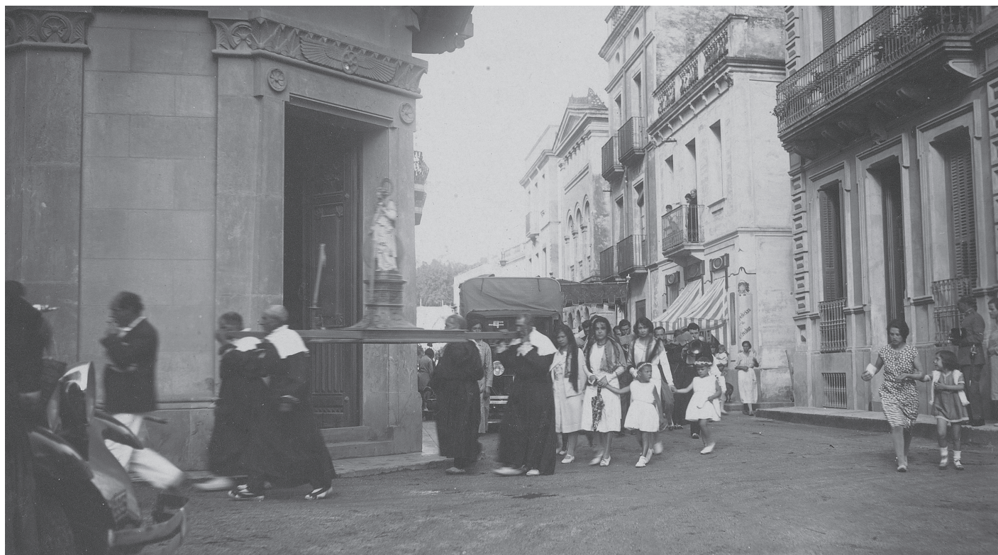
Processó de Santa Cristina al seu pas pel carrer Prat de la Riba, davant de la Casa Egípcia .

Recuperada la pau, els estiuejants tornen a Lloret. Un d'ells va ser el pintor Josep de Togores que va arribar l'any 1940 per passar l'estiu i li va agradar tant que va tornar els anys següents. Va formar una tertúlia que es reunia a l'últim pis de la Casa Egípcia , llavors un "edifici públic". 16 En relats d'alguns dels assistents a les reunions, va ser la dècada de 1940 l'edat d'or de la cultura lloretenca amb seu a les golfes de la Casa Egípcia , que havien batejat com L'Ou Ferrat , en al·lusió al Cau Ferrat de Santiago Rusiñol a Sitges, vila en la qual Lloret s'hi emmirallava. Les parets estaven decorades amb els retrats al carbó dels membres i visitants d'aquella sorollosa acadèmia dibuixats per Togores, que ell denominava la "Capella Sixtina" de Lloret 17 .