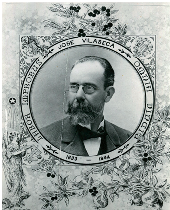
Fotografia de Josep Vilaseca i Casanovas, retrat oficial del Col·legi d'Arquitectes.

Però on la fantasia i el gust pel detall històric de Vilaseca es va fer més palès va ser a l'interior, que estava profusament decorat amb motius plenament egipcis: “en destacaven el lleó alat de la paret del fons de l'escala i les escultures de faraons a l'entrada de la residència” 8 . Rosemarie Bletter troba semblances amb alguns dissenys de Piranesi, en qui Vilaseca s'hauria pogut inspirar, com la xemeneia del menjador també en forma de piló, així com la decoració de columnes i frisos d'estil egipci. Lamentablement, com a conseqüència de les modificacions al llarg dels anys i la seva final demolició no queda cap vestigi de la luxosa i exòtica decoració interior. Ens en podem fer una idea pels dibuixos de l'arxiu de Vilaseca conservats a l'Art Institute of Chicago