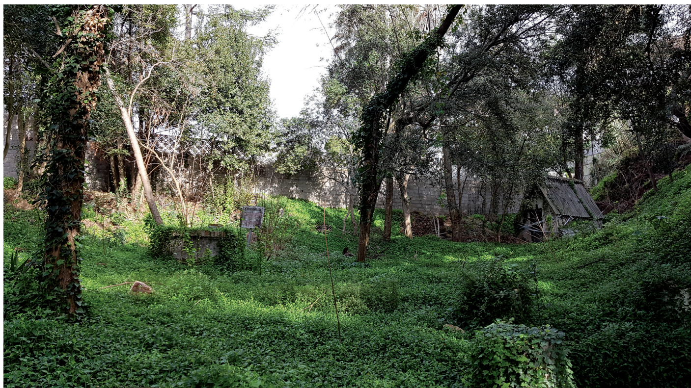
El pou, en primer terme, i la caseta de recepció i repartiment d’aigües de la Mina Melitrons, a la dreta.