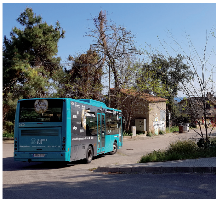
El carrer de Miquel Martí i Pol, en primer terme, i l'avinguda de Nicolau Cabañas, on hi circula el bus de la línia L4, al fons.