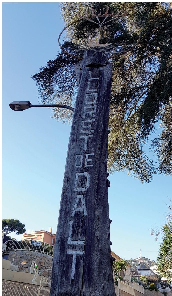
El tòtem de fusta que dona la benvinguda a la urbanització al començament de l'avinguda de Lloret de Dalt.

Descobrim que els primers carrers es van començar a obrir el 1955 4 i que l'Ajuntament de Lloret de Mar va tenir a