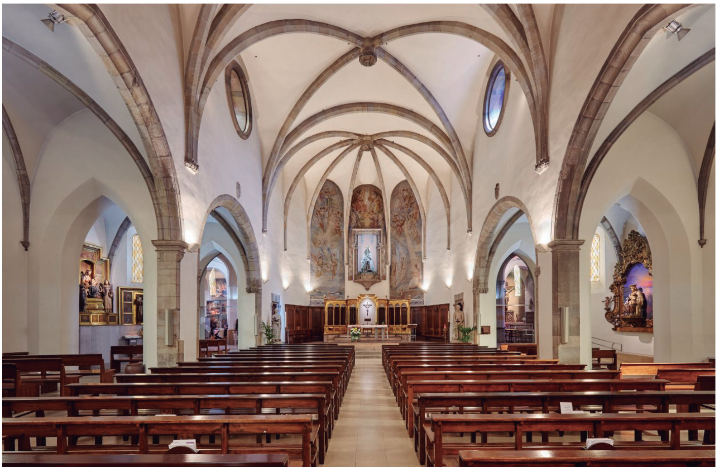
La nau de l'església parroquial amb les capelles laterals.

De nou se salva el desequilibri causat per una ampliació d'un espai, construint-ne, en aquest cas gràcies a una iniciativa particular, un altre d'equivalent i de proporcional en l'extrem oposat, retornant la simetria com a base de composició i volums. En paral·lel la mateixa àrea de la capçalera s'havia vist obligada a evolucionar per igualar l'extensió que les capelles laterals havien donat a la nau. El presbiteri queda realçat amb els dos cossos auxiliars que l'escorten en la seva funció sacramental, doncs els espais pels ministres de Déu no poden ser de menor entitat que les zones dels fidels. La capçalera del temple guanya en prestància i, d'altra banda, les idèntiques dimensions en amplària de la nau, permeten reequilibrar tot el temple. Finalment, a mitjans del segle XVIII, podem considerar, estructuralment parlant,