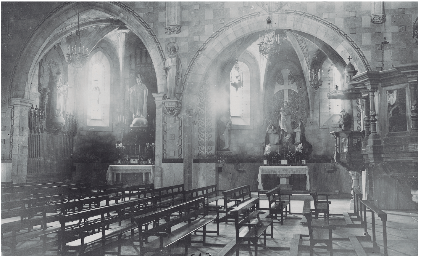
Retaules, altars i altres elements decoratius de l'interior de l'església parroquial de Sant Romà. Data: 1930. CID: 803.084.100_506.084.112.

Una renovada atmosfera, neta i lluminosa, s'escampa per cadascun dels àmbits del temple i el magnifica. Es va difuminant la primera idea de com es va concebre la parròquia nova, imponent i robusta, en favor d'una evolució que en suavitzava la contundència, tendint l'espai a una creixent sensació d'ingravedesa. Cada vegada que els murs s'obren a nous espais, la lleugeresa guanya terreny en la delimitació de l'estructura perimetral. La geometria interna basada en l'equilibri i la simetria entre volums harmonitza i dona coherència al conjunt. Fins i tot s'hi pot intuir l'entrada de l'alè reformador de nous temps i de noves idees artístiques, noves concepcions dels espais arquitectònics, la llavor de la futura exuberància dels jocs de volums, de llums, de complexitats espacials de l'arquitectura religiosa barroca, que a poc a poc s'anirà obrint pas, i que acabaran manifestant-se en d'altres temples.