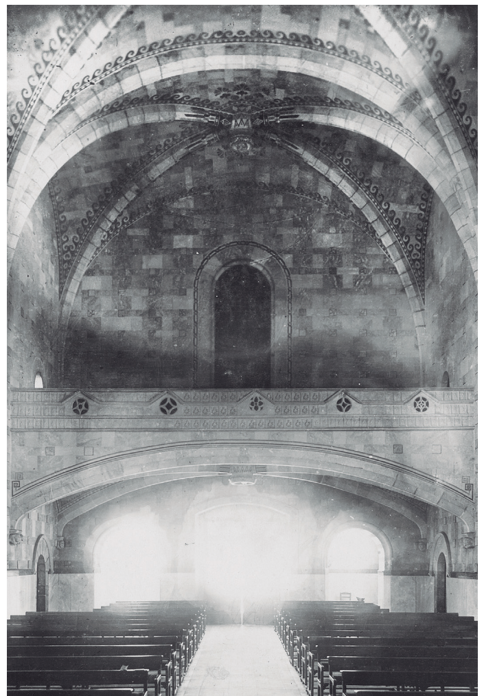
Cor per a l'orgue de l'església parroquial de Sant Romà.

s'hi recullen interessants contractes d'obra. Ara bé, arrel de recents investigacions, en una cerca centrada en les visites pastorals 4 i d'altres documents de l'època, han aparegut noves dades sobre la construcció de nous altars i capelles en aquella parròquia, especialment a partir del segle XVII. Una vegada inaugurada la nau el 1522 la primera visita pastoral que trobem és de 1527. S'hi detalla l'altar major, un altar a la "Beata Marie", la Mare de Déu, i un altar a sant Antoni. No consta cap més advocació ni altar. Aquest darrer sant seria el disposat a la capella propera a l'altar, a la cara sud, actualment del Carme, que té a la clau de volta sant Antoni Abad esculpit. Això permet constatar que hi havia la nau, ja amb les dimensions actuals, amb la capçalera de l'altar i una capella lateral oberta al mur.