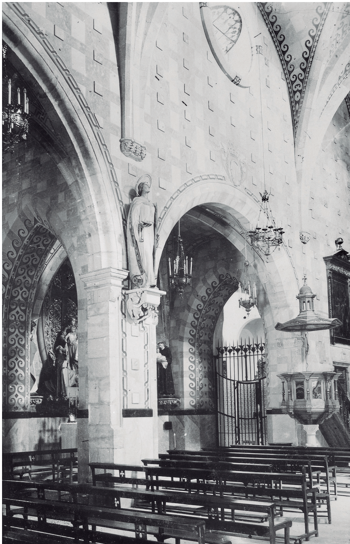
Retaules, altars i altres elements decoratius de l'interior de l'església parroquial de sant Romà. En primer terme la imatge de santa Llúcia.

La capella de la Immaculada Concepció de Vicenç Maig, paradoxalment, en el moment que pren forma, sembla demanar que se n'aixequi una d'equivalent al davant. Així ho entén la Confraria de Pescadors de Sant Pere replicant-ne l'estructura: equilibra els volums de la nau central i capelles laterals, que ara definitivament poden formar un conjunt simètric