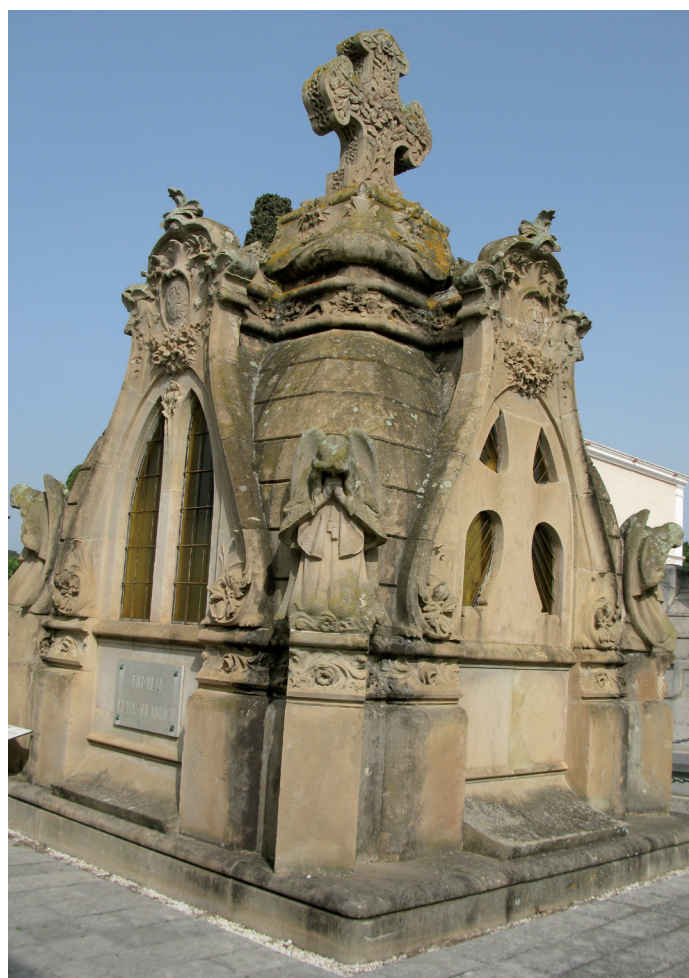
Fig 2. Panteó Cabañas, que mostra una rica decoració floral i on es veuen els àngels agenollats col·locats als quatre angles tallats. Autoria: Maria A. Barnadas Andinach.

“[...] 3.500 ptas – Tres mil quinientas pesetas del Sr Dn Jose Cabanyes por el panteon de Lloret ejecutado bajo la dirección de Dn Vicente Artigas [...]”