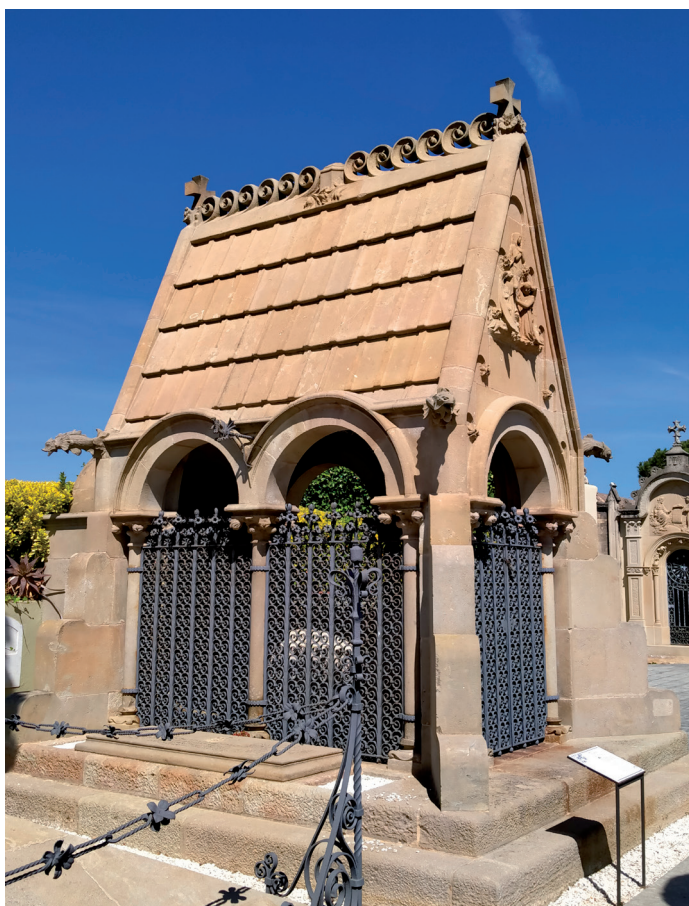
Fig. 5. Aspecte actual del panteó-capella Costa Macià on s'observen les gàrgoles i el treball escultòric de la part exterior.