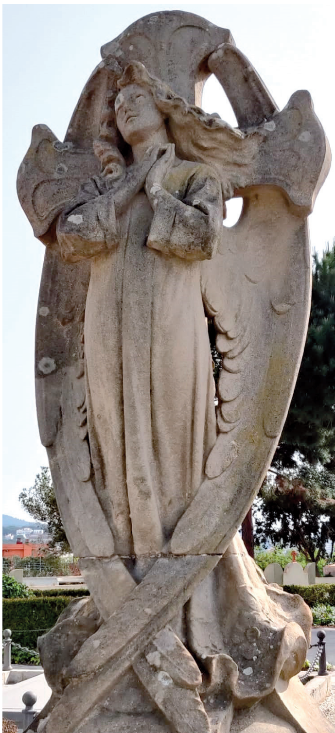
Fig. 7. Aspecte de l'àngel de l'hipogeu Durall Surís amb les mans unides sobre el pit en actitud d'oració i mirant cap al cel.