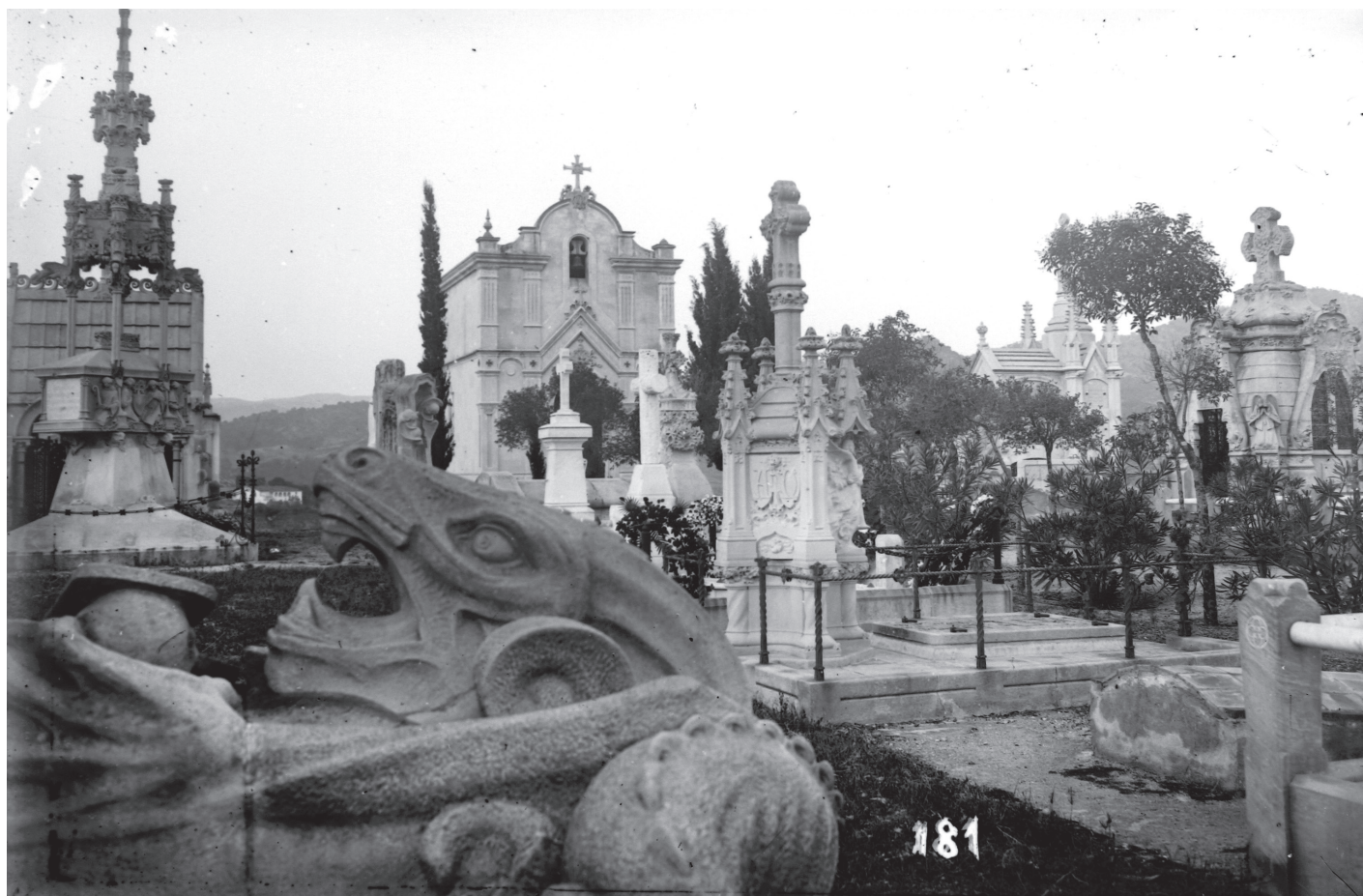
Fig. 4: Vista parcial del cementiri de Lloret de Mar a principis del segle xx, on es distingeix el panteó Cabañas a la dreta de la imatge, envoltat d'arbusts i arbres.

Data: 1920 ca. CID: 510.000.700_302.019.17.