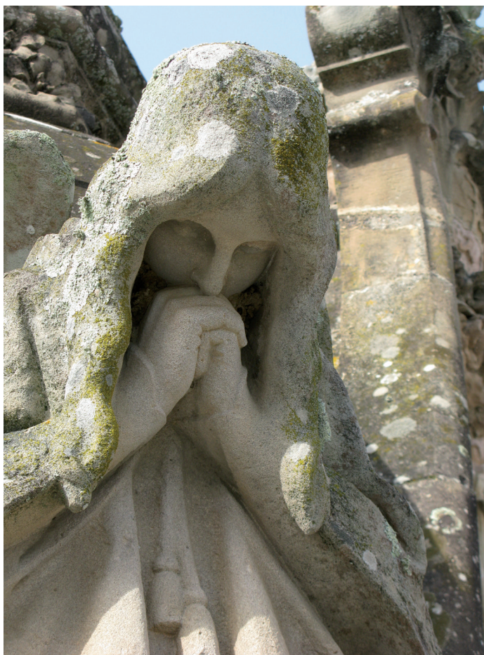
Fig. 3. Detall d'un dels àngels del panteó Cabañas amb el cap inclinat i les mans unides en actitud de pregària i recolliment.

Aquest document indicaria, per tant, la intervenció de Barnadas i Pujol en la construcció d'aquest panteó, sense que puguem establir la naturalesa d'aquest treball. La sepultura és de tipus capella-panteó i mostra una gran riquesa escultòrica. A l'exterior destaquen els àngels situats als quatre angles, que no constaven al projecte. (Fig. 2-3) L'edificació mostra dos nivells de frisos florals al seu voltant i la coberta està rematada per una creu ricament adornada amb fulles i flors per les dues cares. Considerem que aquesta rica decoració floral, pròpia de l'Art Nouveau, estaria en harmonia amb els arbres i arbustos que hi havia al cementiri a principis de segle xx, com es constata a la