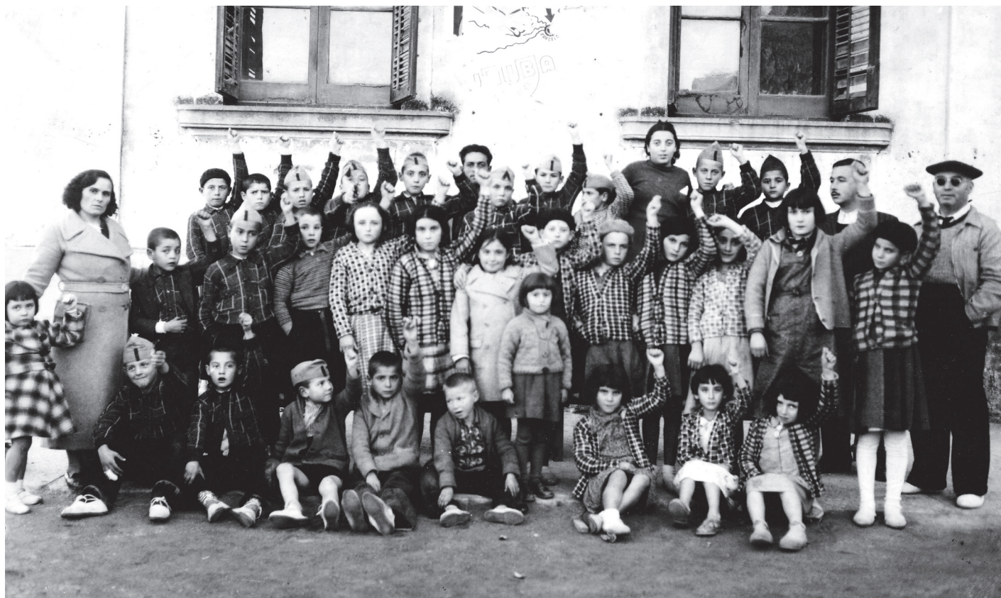
Retrat a cos sencer d'un grup d'escolars i nens refugiats de Velilla de Ebro davant de l'Ajuntament de Lloret de Mar. Data: 1937. Data: 1937. CID: 510.000.700_500.025.123.

Totes aquestes accions internacionals d'evacuar els seus ciutadans van arribar fins i tot a les poblacions costaneres de Girona i Barcelona. El dia 28 de juliol de 1936, a Lloret de Mar va aparèixer el destructor italià Grecale amb la missió d'evacuar els ciutadans italians i alemanys residents a la zona. La prova d'aquest fet és l'informe