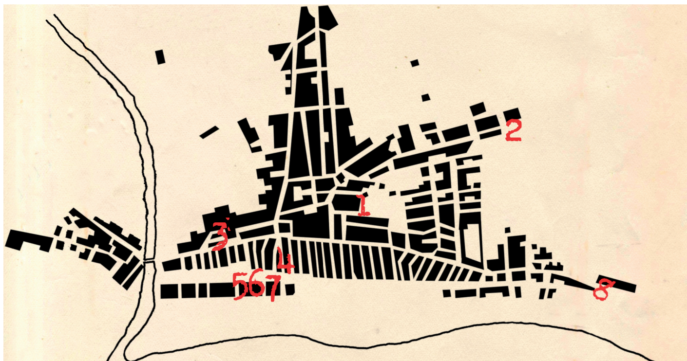
Plànol de Lloret on hi ha marcades les cases on s'hi acollien refugiats: 1- Can Pius. 2- Can Gallissà. 3- Can Mossèn Carlu (Casa Grassot Guinart). 4- Can Rosals (casa de la família Pujol de Llobet i Fornés). 5- Can Domingo. 6- Casa Dr. Coll. 7- Can Pujol (la Casa Egipcia). 8- Can Pinyol.

El Servei d'Arxius Municipal de Lloret de Mar conserva correspondència personal on hi ha constància de la greu situació causada principalment per la manca d'aliments, ocasionada per la mala gestió i per la gran afluència de refugiats a la vila. Una d'aquestes cartes descriu aquests fets 10 :