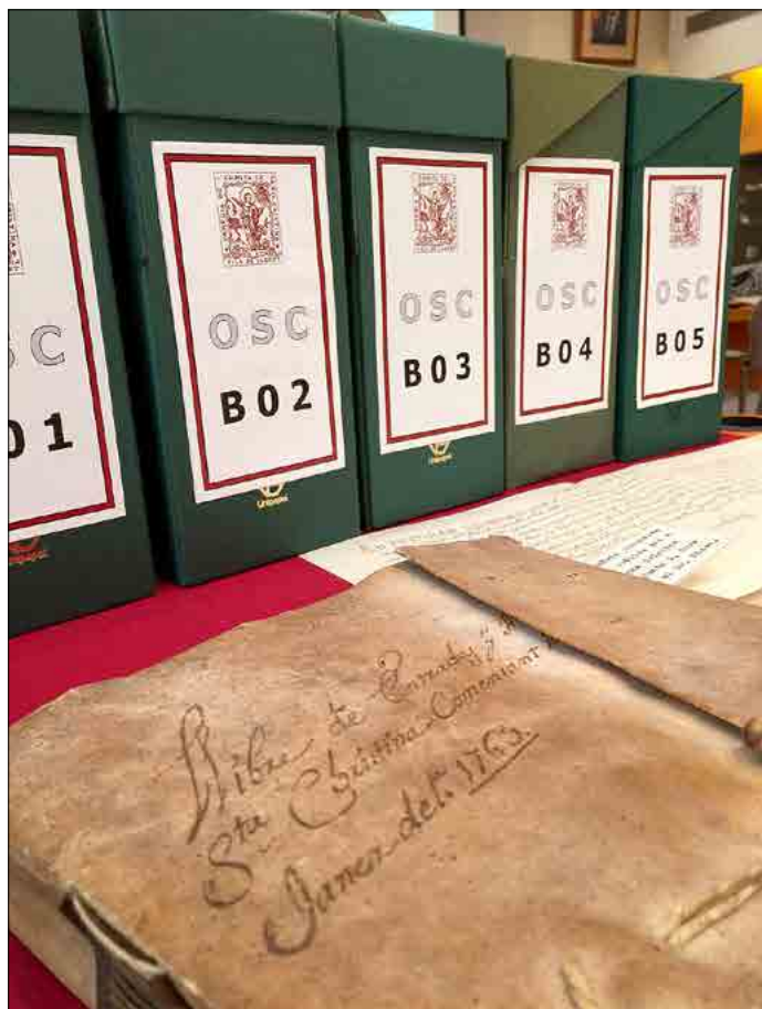
Una part de la documentació del fons de l'Obreria de Santa Cristina.