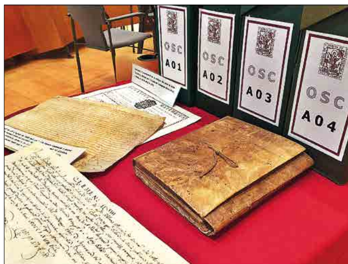
El Llibre de Entradas y Aixidas de Santa Christina, comensant lo dia 15 de Janer del 1763 (1763-1824) de l'Obreria de Santa Cristina.

Pel que fa a les filmacions, han ingressat dues pel·lícules diferents. La primera es tracta d'una filmació feta els anys 1914 i 1915 per la productora francesa Gaumont. Aquesta pel·lícula es conserva actualment en tres formats diferents: