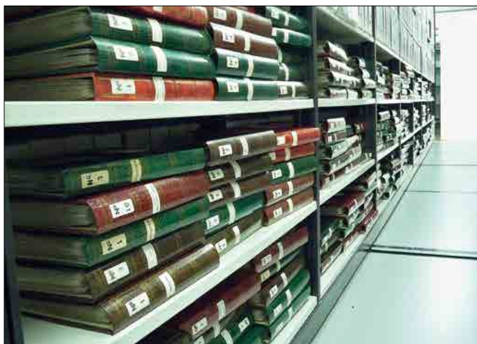
Ingrés dels àlbums de fotografies del fons de Josep Valls.

S'ha de dir que les mostres les preparava amb meticulositat, cura i paciència; i les seves exposicions eren les més visitades perquè bona part de la població lloretenca podia reviure