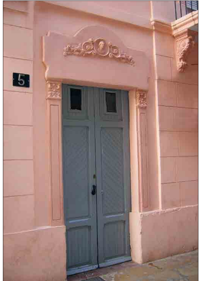
Porta d'entrada a l'habitatge del carrer Màrtirs, núm. 5.

L'estil dels edificis responia naturalment al moviment imperant en aquell moment, remarcat alhora per les conviccions de l'arquitecte o l'autor del projecte, d'una