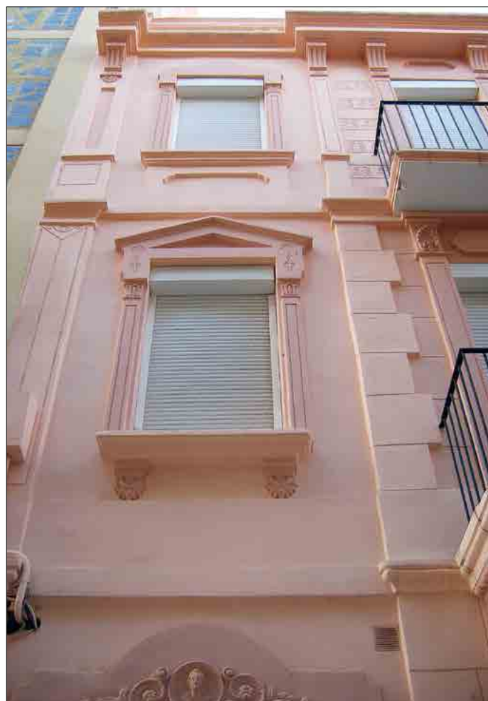
Detall de l’emmarcament de les finestres.

D’altra banda, es pot observar una clara referència al món clàssic. Fixem-nos com l’emmarcament de les finestres del primer pis presenta la forma d’un temple grec, amb un frontó com a llinda i dos pilars laterals, que simulen sustentarlo, recolzats a l’ampit que actua com a basament. Aquesta proposta es pot comprovar en totes les altres obertures, però amb la variant, en alguna d’elles, que la llinda incorpora una lleu sinuositat que, d’alguna manera, ens recorda la corba acampanada, un recurs formal característic de Rafael Masó. La profusió de detalls decoratius, com són els esgrafiats d’alguns paraments plans, els grafismes que mostra cada columna, els volums dels capitells curiosament abillats, les incrustacions de detalls ornamentals així com els reenfonats de sota algunes finestres queden enquadrats per les cantoneres del bloc central i les columnes laterals, de manera que s’aconsegueix una composició rica i