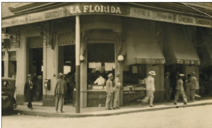
Façana del Bar Restaurant La Florida al carrer Obispo y Monserrate de la ciutat de Cuba. 1925 ca.