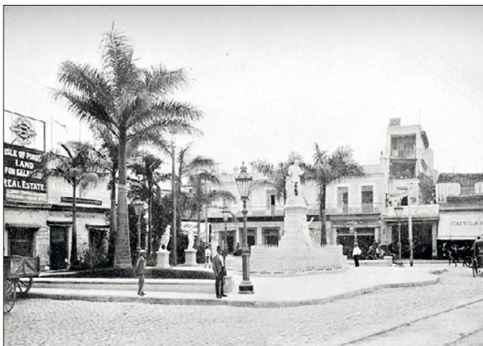
Plaza de Albear de la ciutat de l'Havana. A la dreta l'establiment La Florida. 1902.