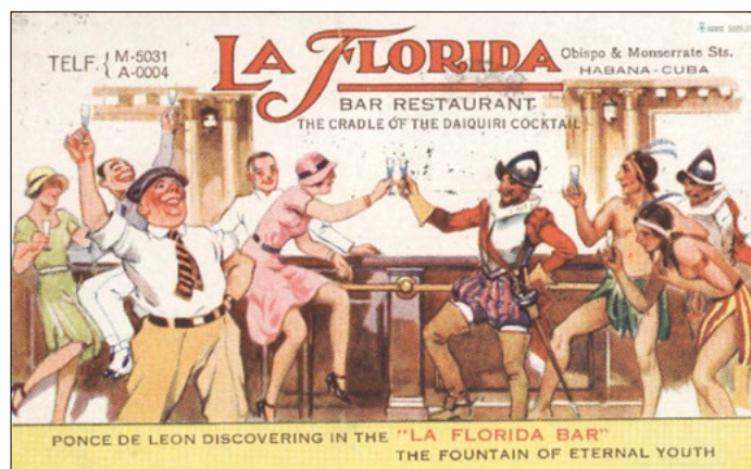
Targeta postal del Bar Restaurant La Florida. 1930 ca.