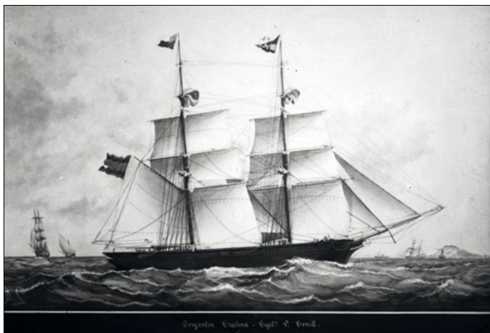
Bergantí Cristina. 1920 ca.

Procedència: SAMLM. Fons: Martínez-Planas. Autor: Emili Martínez i Passapera. ST: 302.026.022