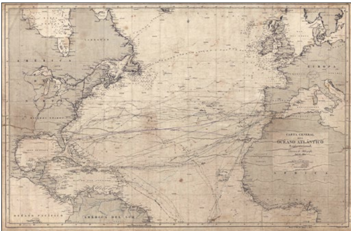
Carta general del Océano Atlántico Septentrional. 1872.

Procedència: SAMLM. Fons: Guinart-Ball-Ilatinas-Xiberta. Autor: C. Leclercq ST: 092.021.028