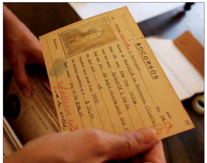
Fitxa de beneficiari de la Societat de Beneficència de Naturals de Catalunya de l'Havana (Cuba). Procedència: Arxivers Sense Fronteres.

Avui els projectes importants d'AsF són la recuperació de l'Arxiu Nacional de la República Àrab Sahràuí Democràtica (RASD) i dels Casals Catalans. L'Arxiu Nacional de la RASD es troba en un estat molt precari. L'edifici i les condicions climàtiques, a més de l'enclavament on es troben, en el camp de refugiats de Tindouf, enmig del desert algerià, fa que es renovi anualment l'ajuda provinent del Ministerio de Cultura per tal que puguin continuar tractant la documentació, inclosa la seva digitalització, assegurant així la seva conservació. El projecte dels Casals Catalans, tal com s'ha mencionat anteriorment, s'inicià a partir de les prospeccions que es dugueren a terme l'any 2006 als casals de l'Havana, de Mèxic, de Buenos Aires i de Rosario. D'aleshores ençà, i mitjançant l'ajuda del Departament de Cultura de la Generalitat de Catalunya, s'ha pogut treballar la recerca, ordenació, classificació, descripció i digitalització de la documentació perquè, finalment, sigui transferida a l'Arxiu Nacional de Catalunya i pugui ser accessible a aquelles persones que hi estiguin interessades. No tots els