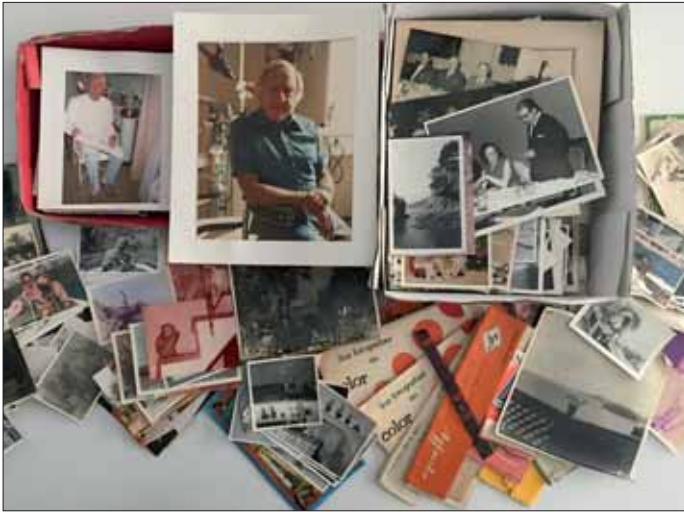
Una mostra de les fotografies del fons d'Ernest Adler.

context inicial en que es van crear cadascun dels documents; i de l'altre, ens facilitaria l'agrupació i la classificació jeràrquica del fons documental. A través d'aquesta visió de conjunt es va elaborar un Quadre de Classificació que conté les següents seccions documentals: