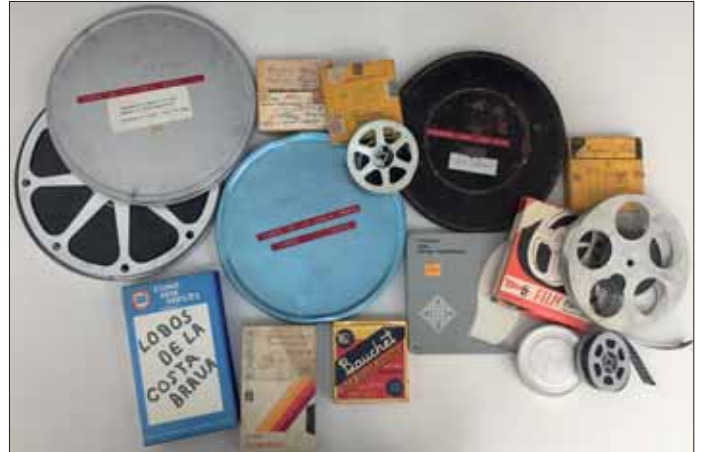
Pel·lícules filmades pel Dr. Adler amb les seves bobines.