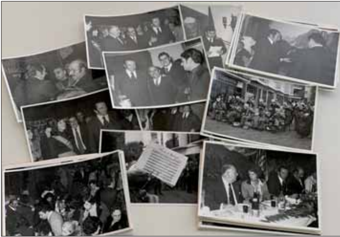
Diverses fotografies de l'acte d'inauguració de la Peña, el 18 de novembre de 1975.