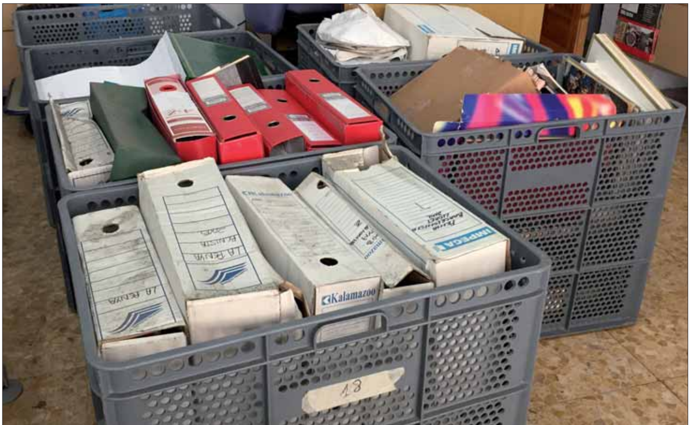
La documentació de la penya en el moment del seu ingrés a l'arxiu.

El fons de la Penya Barcelonista de Lloret està format per 236 registres de documentació textual que inclou els llibres de comptabilitat, llistat de socis, escriptures de la compra del local social, actes de reunions de juntes directives i assemblees, els estatuts, correspondència (amb els socis, altres penyes, amb el F.C. Barcelona, etc.), tot allò relaci-