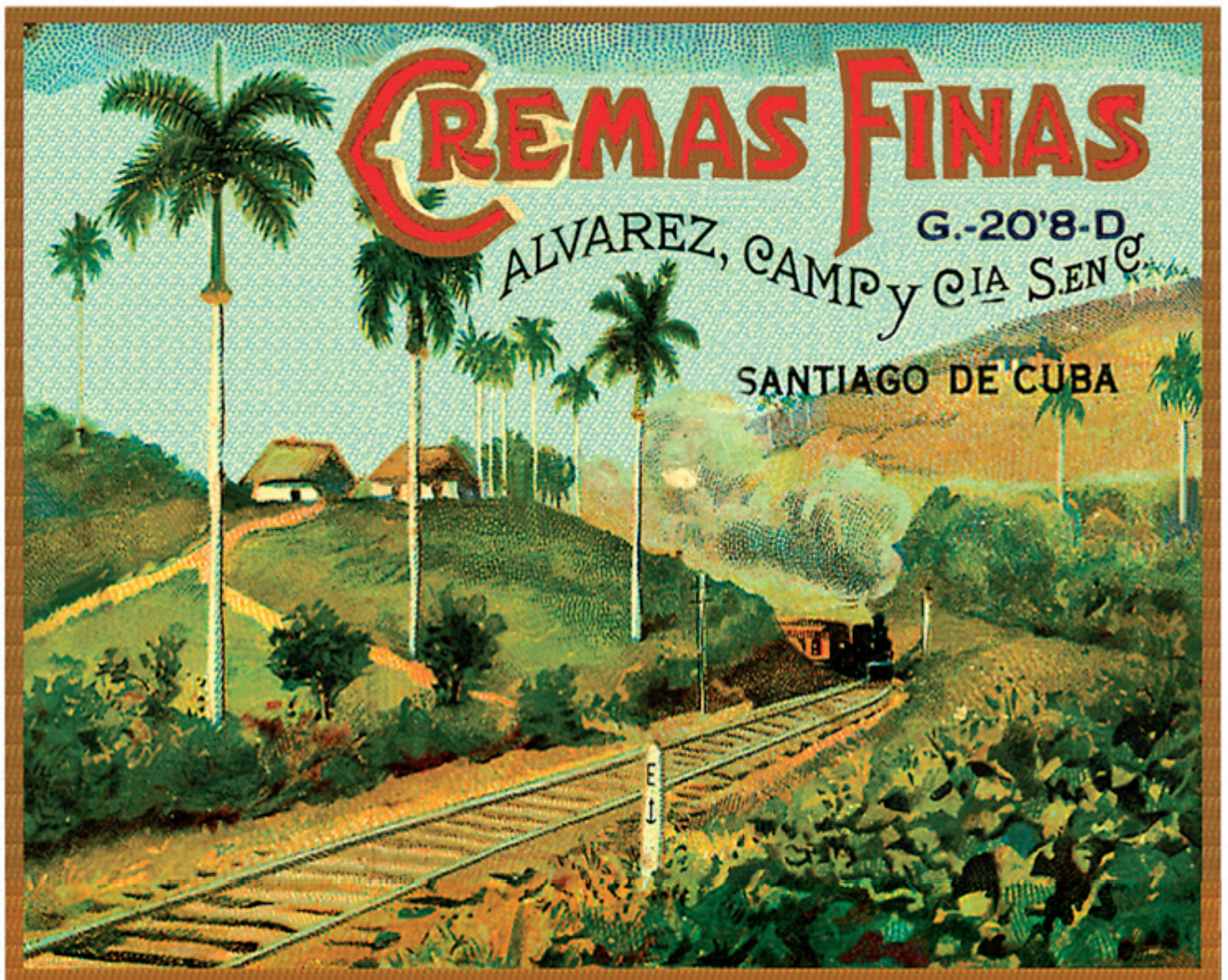
Postal d'un dels productes de les destil·leries Àlvarez Camp. Procedència: Imatge extreta de www.matusalem.com . Data: Ca. 1925.

Com hem pogut comprovar durant aquesta primera fase de cerca, la pèrdua de documentació i l'oblit o la desaparició del lligam familiar amb la població d'origen són causes habituals de la mutilació voluntària o involuntària de la història. I en aquest cas és molt evident. Sense les dades necessàries no podem donar per acceptades o veritables moltes de les sentències que trobem a les xarxes socials o fins i tot als mateixos llibres d'història. Fa ja molts anys que l'emigració va deixar de ser un fenomen social desconegut, encara que convé no oblidar que els cementiris, en aquest cas els cubans, però també el nostre, estan plens d'ossos que tenen moltes històries per explicar. ■