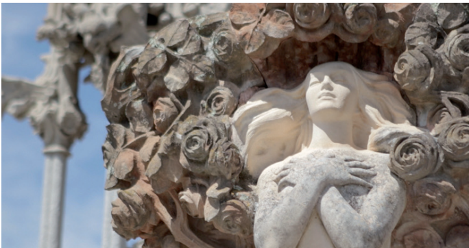
Detall de l'hipogeu Camp Nonell del cementiri de Lloret de Mar.

Aquesta sepultura, concretament la número 3 del passeig central, al marge esquerre de la necròpoli, ens mostra la figura d'una dona amb els braços plegats al damunt del pit, amb els ulls tancats i envoltada d'un roser que adopta la forma de creu. L'atmosfera del conjunt és més aviat de somni que no pas de mort. Un somni en suspens que ha convertit l'hipogeu Camp i Nonell en una de les figures més suggestives de la nostra necròpolis modernista i una de les més estimades pels lloretencs. Rosa Alcoy 6 atribueix a Ismael Smith la responsabilitat d'aquesta creació, tot i que també s'havia parlat de la relació del mateix Antoni Gaudí o d'en Bonaventura Conill i Montobbio amb l'hipogeu. Si assignem a Smith l'autoria de l'obra, com ens sembla més versemblant, estariem parlant de l'única obra de gran format que s'ha conservat d'aquest autor.