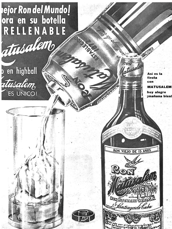
Retall de publicitat a la premsa cubana.

Un cop hem arribat als anys vint del segle passat, apareix un personatge que ha donat peu a la major de les confusions, casuals o forçades, de quasi la totalitat d'historiadors i membres de la indústria dels destil·lats arreu del món.