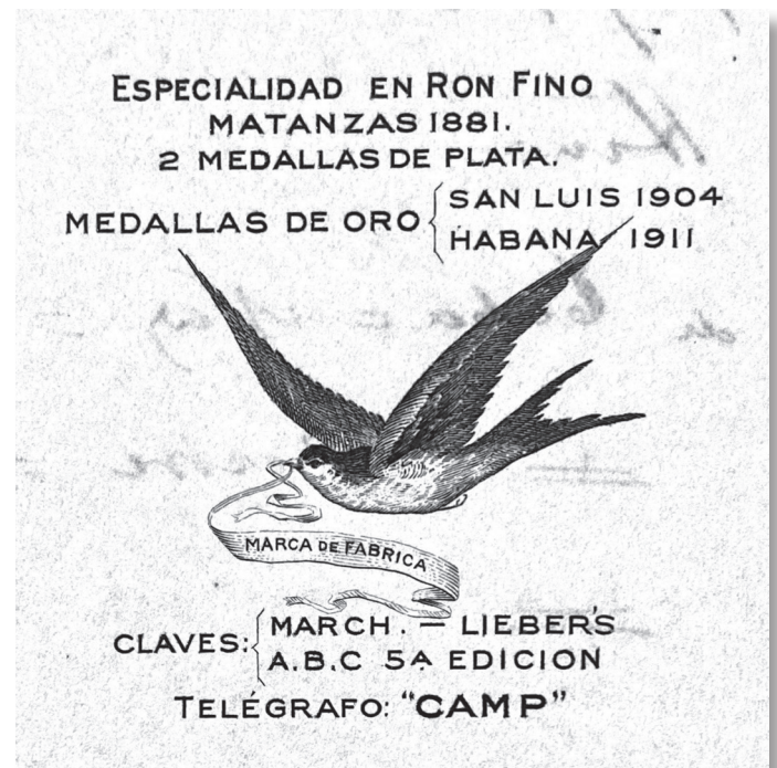
L'oreneta, símbol de la marca. Capçalera de paper comercial. Santiago de Cuba.

En aquesta introducció a una història lloretenca del rom hem parlat molt de dates i personatges i poc del licor i de la seva oreneta com a símbol indissociable. Tindrem