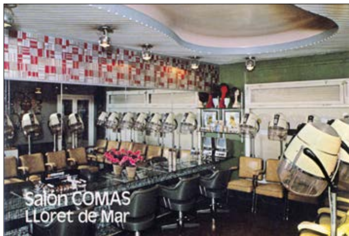
Targeta postal de promoció de la perruqueria Comas.