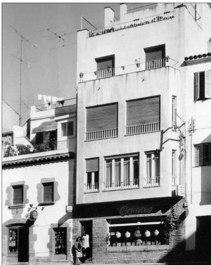
La perruqueria Comas es trobava al C. Cervantes.