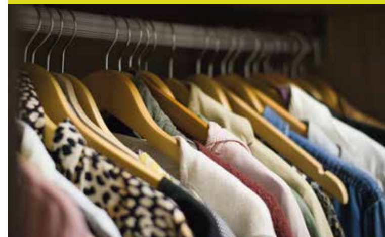
Protecció de comerços