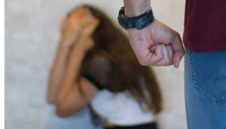
Protecció de les víctimes