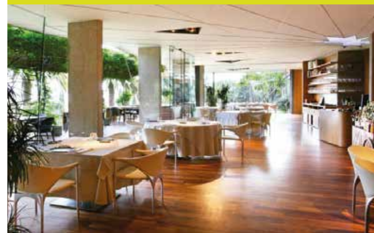
Protecció de bars i restaurants