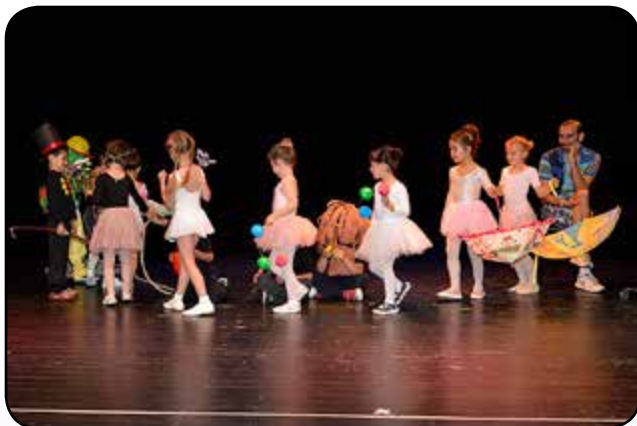
Aula de teatre