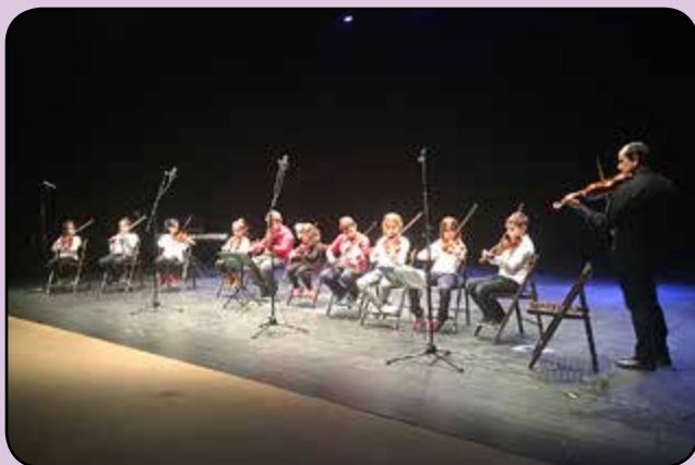
Concert de Nadal