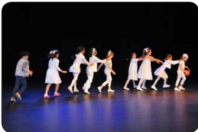
Aula de teatre