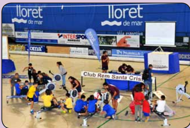
Campionat escolar de rem ergòmetre