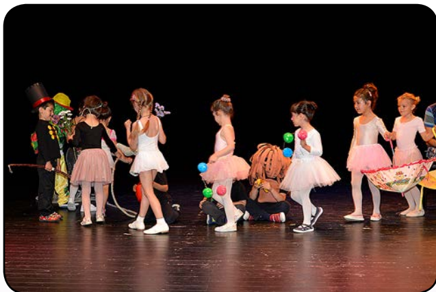
Aula de teatre