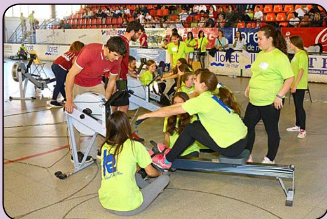
Campionat de Rem Ergòmetre