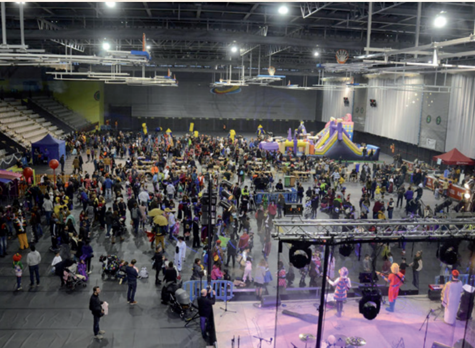
Carnaval de Blanes Ciutat Esportiva 2017.