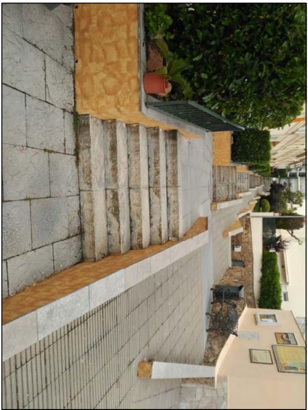
Barana d'acer galvanitzat amb muntants i passamans circulars