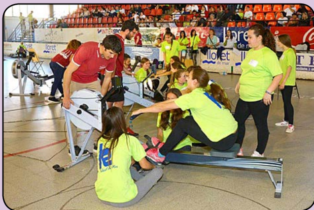
Campionat de Rem Ergòmetre