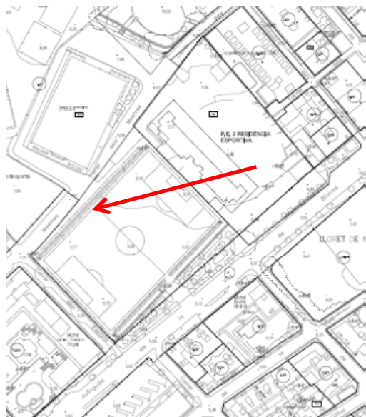
3. Camp futbol municipal (PE 1A clau 1.4.F)