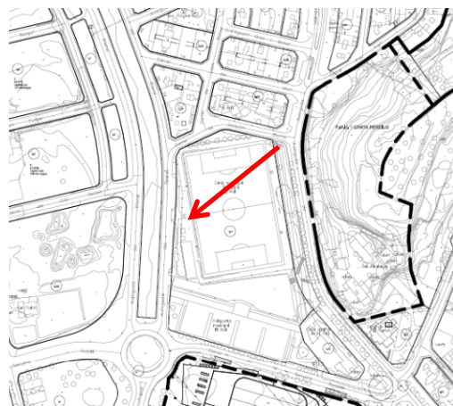
2. Camp futbol Molí (clau 1.4.F)